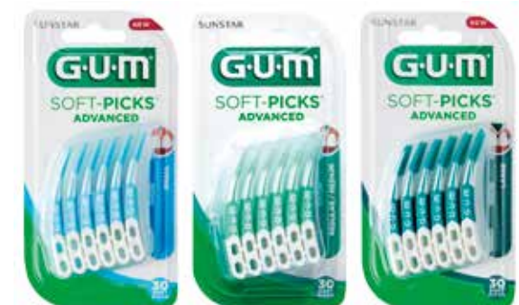
SMALL MEDIUM LARGE

Maila info@se.sunstar.com eller ring 031-87 16 10 för prover!